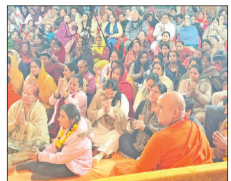
रोहताक। भजन और कीर्तन का आनंद लेते भक्तजन।