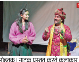
रोहतक। नाटक प्रस्तुत करते कलाकार।