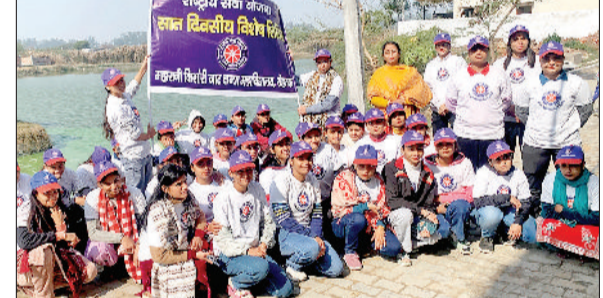
रोहतक। मायना गांव में आयोजित शिविर में मौजूद विद्यार्थी।