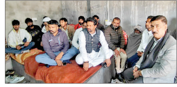
रोहतक। मन की बात कार्यक्रम सुनते भाजपा कार्यकर्ता।

किसी भी लड़की की शादी होने पर उसके आधारकार्ड का पता समेत दूसरी जानकारीयें ससुराल के मुताबिक हो जाती हैं। यानी के पिता के नाम की जगह पति का नाम और पता। ऐसे में अब महिलाएं जब आईडी बनाने के लिए प्रशासनिक अधिकारियों के पास जाती हैं तो आईडी नहीं बन रही। क्योंकि डाटा मैच नहीं होता। ध्यान रहे कि एक गुरख्खा में 25 एकड़ जमीन होती है। इस जमीन के जितने भी मालिक होंगे, वे सभी बुकेट कवलाएंगे। रोहतक जिले में 412528 बुकेट हैं।