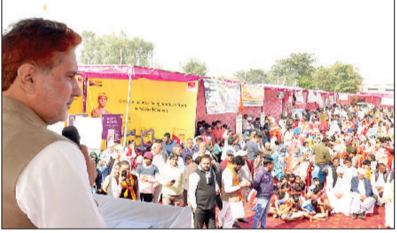
रोहताक। आयोजित कार्यक्रम को सम्बोधित करते मुख्य अतिथि भाजपा के वरिष्ठ नेता एवं राज्यसभा सांसद सुभाष बराला।

माली आनंदपुर में शहीद चंद्रशेखर सेवा समिति के सौजन्य से आयोजित मेरा गांव—मेरा तीर्थ 10वां ग्रामोत्सव कुटिया वाले मैदान में अत्यंत भव्य और ऐतिहासिक रूप से संपन्न हुआ। ग्रामोत्सव में ग्रामीण संस्कृति, आत्मनिर्भरता, सेवा और सामाजिक समरसता का ऐसा अद्भुत दृश्य देखने को मिला कि पूरा क्षेत्र उत्सवमय वातावरण में रंगा नजर आया। आयोजन में बड़ी संख्या में ग्रामीणों, महिलाओं, युवाओं और बच्चों की भागीदारी रही। कार्यक्रम के मुख्य वक्ता राष्ट्रीय स्वयंसेवक संघ के उत्तर क्षेत्र प्रचारक जितन रहे, जबकि मुख्य अतिथि के रूप में भाजपा के वरिष्ठ नेता एवं राज्यसभा सांसद सुभाष बराला उपस्थित रहे। संघ के क्षेत्रीय सेवा प्रमुख कृष्ण कुमार तथा क्षेत्रीय ग्रामीण विकास प्रमुख राकेश की गरिमामयी उपस्थिति ने कार्यक्रम को और अधिक दिशा प्रदान की। उद्योग जगत से वी-सेल्स गुरुग्राम के चेयरमैन रामचंद्र अग्रवाल और उद्योगपति सुमित श्याम विशिष्ट अतिथि के रूप में शामिल हुए। ग्रामोत्सव में लगभग डेढ़ सौ स्टॉल लगाए गए, जिनमें ग्रामीण अंचल के लोगों द्वारा स्थानीय साधनों और संसाधनों से निर्मित